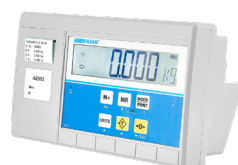
Indicador AE 503