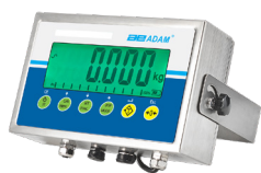
Indicador AE 403